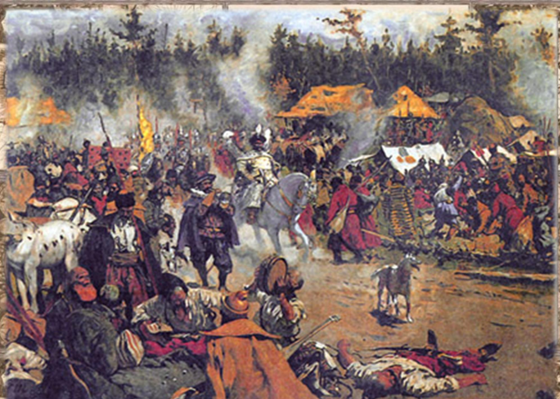
С.В. Иванов. "В смутное время"