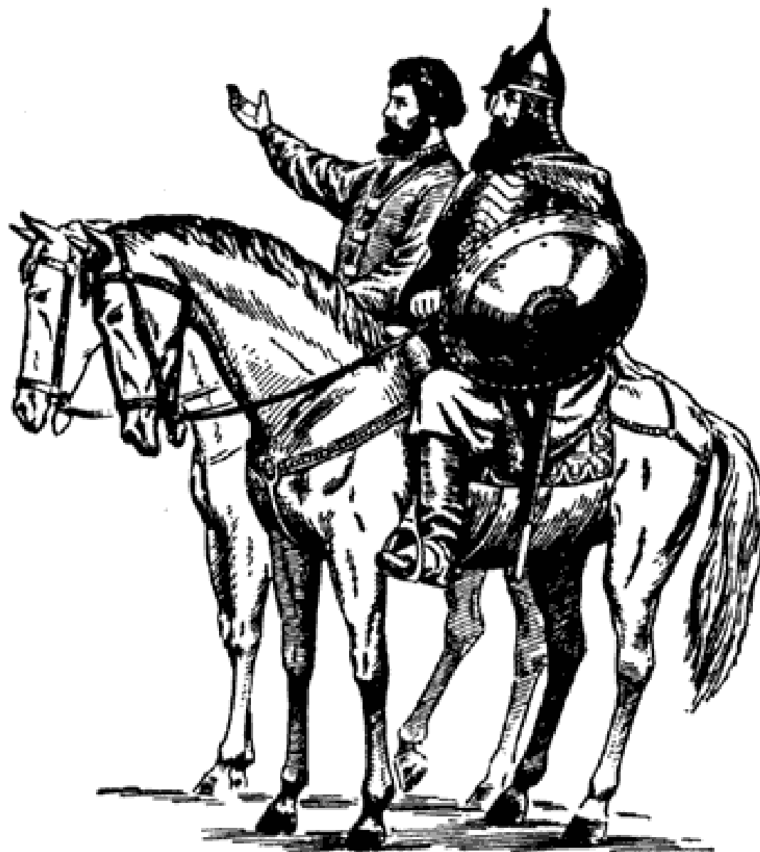
Дмитрий Пожарский и Кузьма Минин